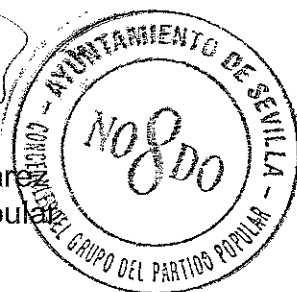
Ignacio Flores Berenguer Concejal del Grupo Popular